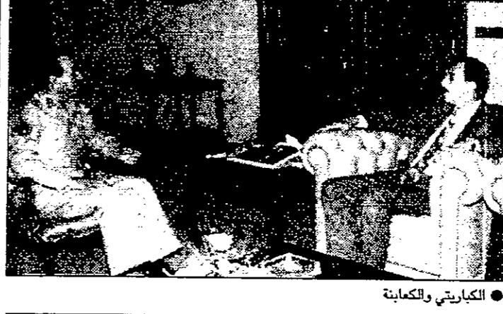
عمان - بترا - زار السيد عبدالرحمن الكبيارتي رئيس الوزراء وزير الدفاع يرافقه وزير التمييز صباح امس القيادة العامة للقوات المسلحة حيث اجتمع بالمشير الركن عبدالحافظ مرعي الكعبانية رئيس هيئة الاركان المشتركة وتم بحث عدد من الامور التي تبهم القوات المسلحة.